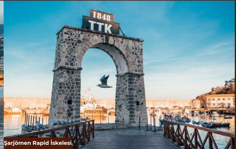
Şarjömen Rapid İskelesi