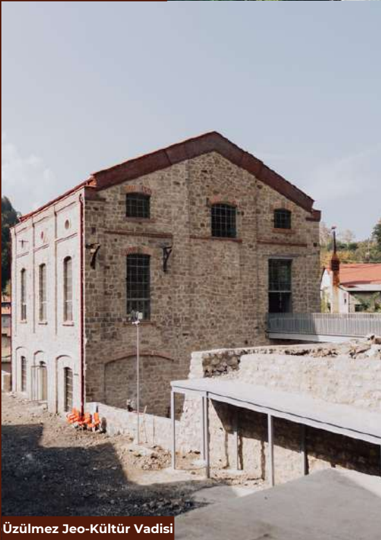
Üzülmez Jeo-Kültür Vadisi