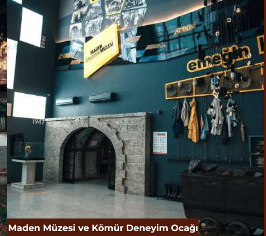
Maden Müzesi ve Kömür Deneyim Ocağı