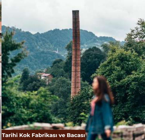
Tarihi Kok Fabrikası ve Bacası