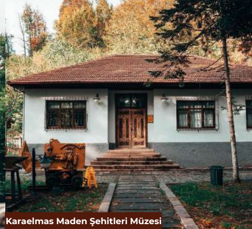
Karaelmas Maden Şehitleri Müzesi